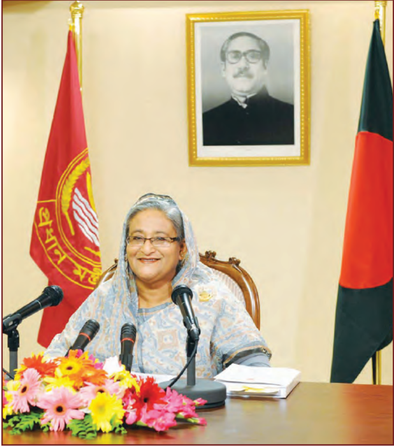
গণপ্রজাতন্ত্রী বাংলাদেশ সরকারের মাননীয় প্রধানমন্ত্রী শেখ হাসিনা